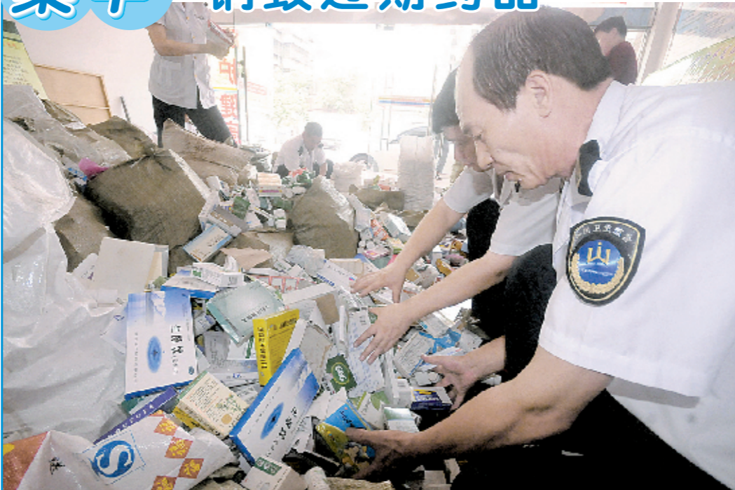
近日,平顶山市卫东区卫生局、卫生监督所将查扣的600多个品种、50余麻袋的违规、过期药品,在市区平安大道北侧的焦庄生活垃圾处理场进行了集中销毁,这是该区近年来销毁过期药品数量最多的一次。图为卫生监督执法人员正在对即将销毁的药品进行分拣。